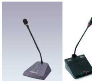
SONY リクエストマイク DIS リクエストマイク