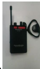
パナガイドシステム

大きく分けて以上の3種類の方式に分類され それぞれレシーバーへの送信方法が違います。