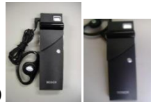
DIS 赤外線システム(デジタル)