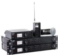
SHURE ULX-D ピンマイク・ハンドマイク