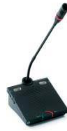
DIS リクエストマイク

講演者用に演台の左右から 二本設置したり、リクエストマイク風に 使用したりします。