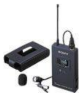
ソニー ピンマイク