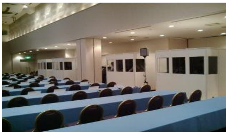
5カ国語同時通訳会議での使用例

言語数-1になります。例えば 5カ国語の同時通訳会議ですと、 5-1=4 ブース必要です。