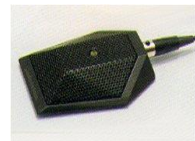
バウンダリーマイク