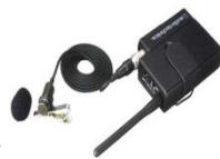
テクニカ ピンマイク