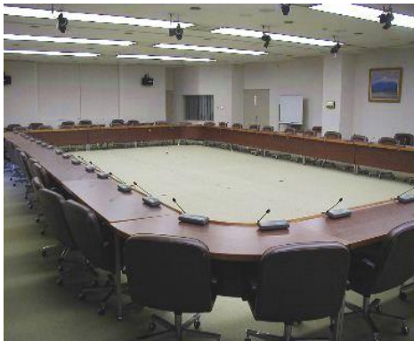
会議マイクシステムを使った会場

会議などでは、発言者に対し一人一本のマイクが望ましく、会議マイクシステム(リクエストマイク)を何十本と設置する場合があります。